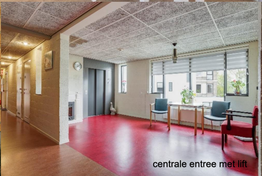
centrale entree met lift